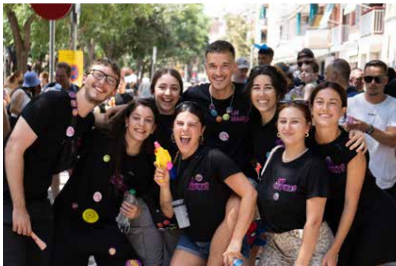
Les penyes, element central de la Festa Major. 9 Barris Imatge

En una zona històricament caracteritzada per la participació veïnal i la lluita per millorar les condi-