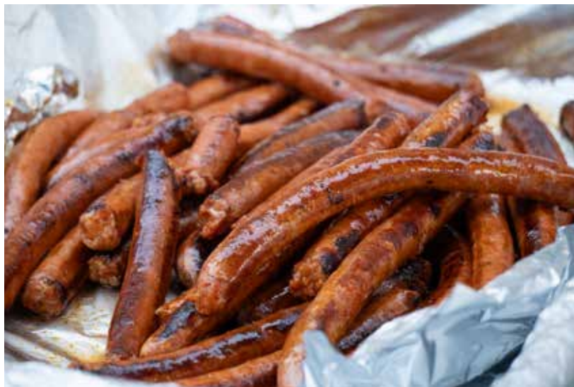
La xistorrra, element central del Xistorra Rock. 9 Barris Imatge