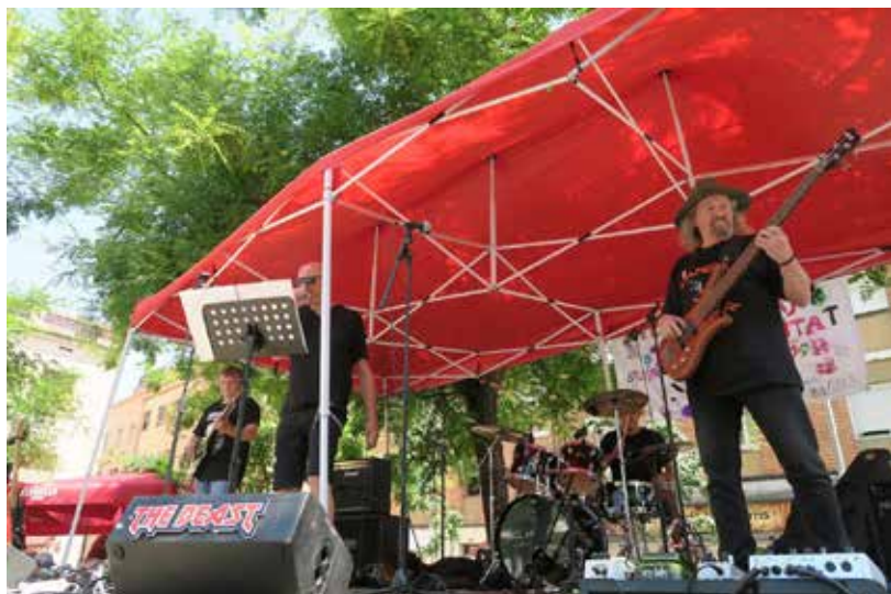
Hallowed Be The Beast al Colesterock, a la plaça Nou Pins.

Bajamos de Molí hasta la plaza Nou Pins para comprobar el músculo rockero del Colesterock, organizado por Penya Asarock. Allí disfrutamos del ritmo rockero de la cover band Inoxidables Rock Band y del monstruoso tributo a Iron Maiden por parte de Hallowed Be The Beast . Calor, sol, cerveza y heavy.