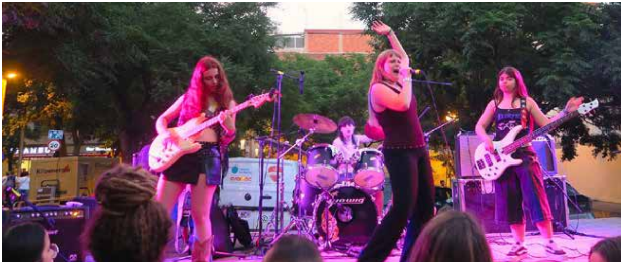
Les joves promeses del rock, Elektra, al Xistorra Rock.

y DJCBO . ¡¡Tremendas sesiones, trayendo la ruta del bacalao a La Prospe!!